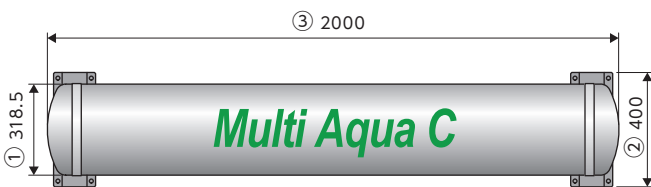
製品上部方向より見た図[1本仕様]

災害発生時に避難・復旧作業拠点となる工場横の独身寮へ飲料水の確保として設置。全体の必要容量からいえば僅かですが、備えをして置く事で従業員の災害への意識向上にも役立つ事を期待しています。